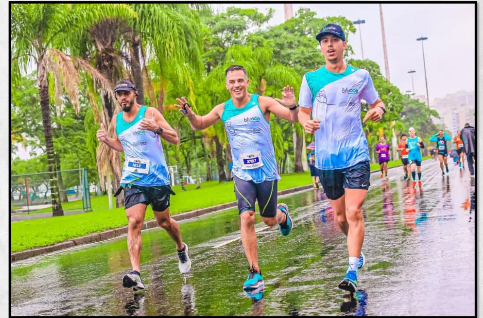
Maratona do Rio, 2022