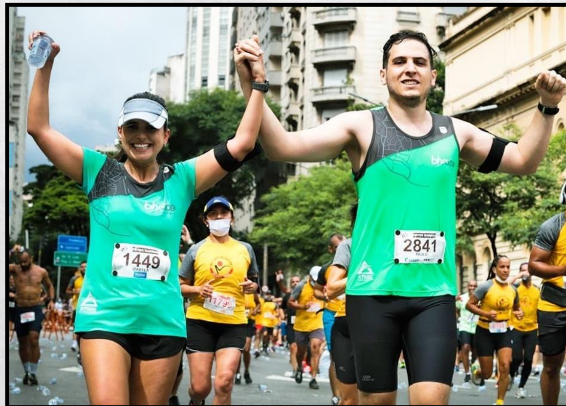
São Silvestre, 2021